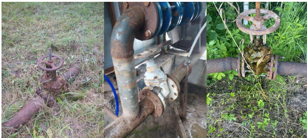
на фото старые задвижки