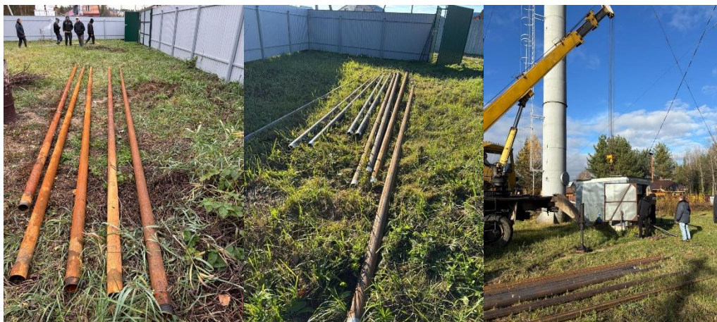
на фото (слева) старые трубы, (справа) новые трубы и процесс замены с помощью автокрана

агрессивным средам, вызывающим коррозию металла, а также окисление транспортируемых сред.