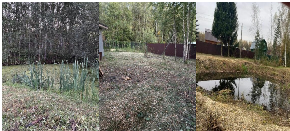
на фото пожарные пруды и площадка за зданием правления после покоса травы