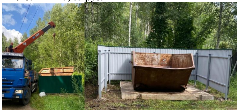
на фото: установка бетонных плит и перенос бункера, новая площадка для сбора мусора