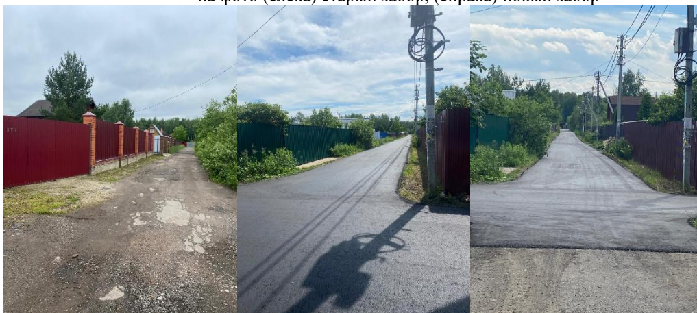
на фото (слева) как было, (справа) как стало