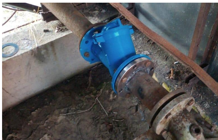
на фото установленный обратный клапан и переходная втулка