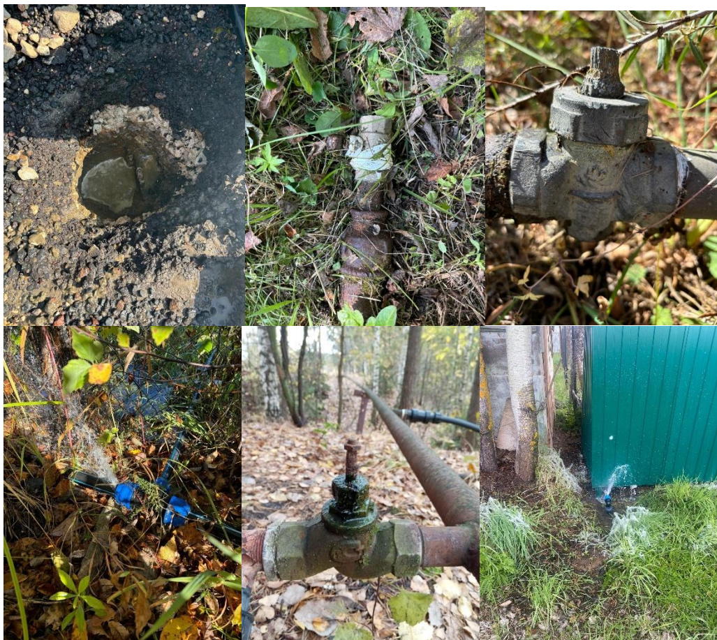
на фото некоторые старые краны и прорывы труб