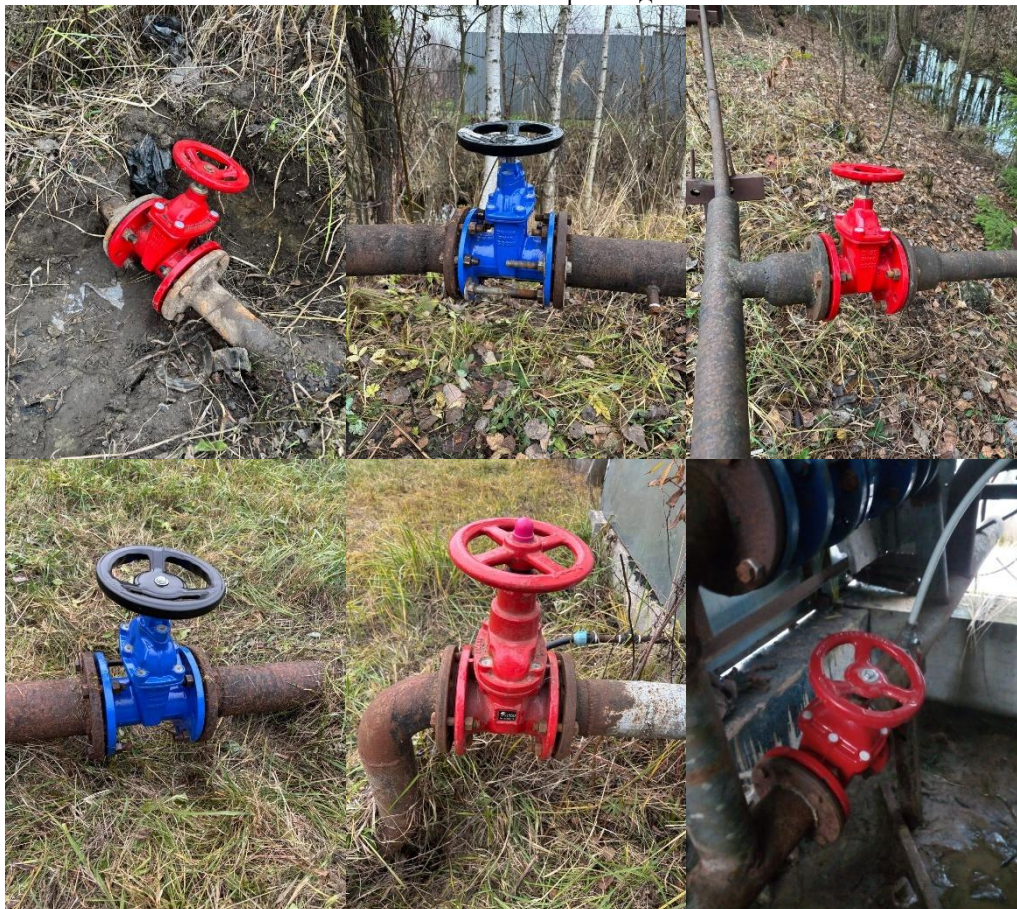
на фото новые задвижки, которые были установлены взамен старых