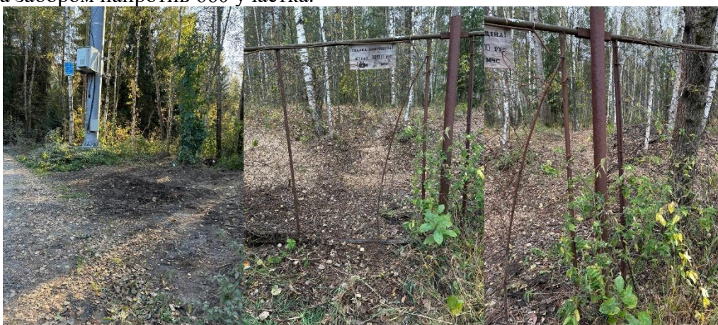
на фото убранные территории