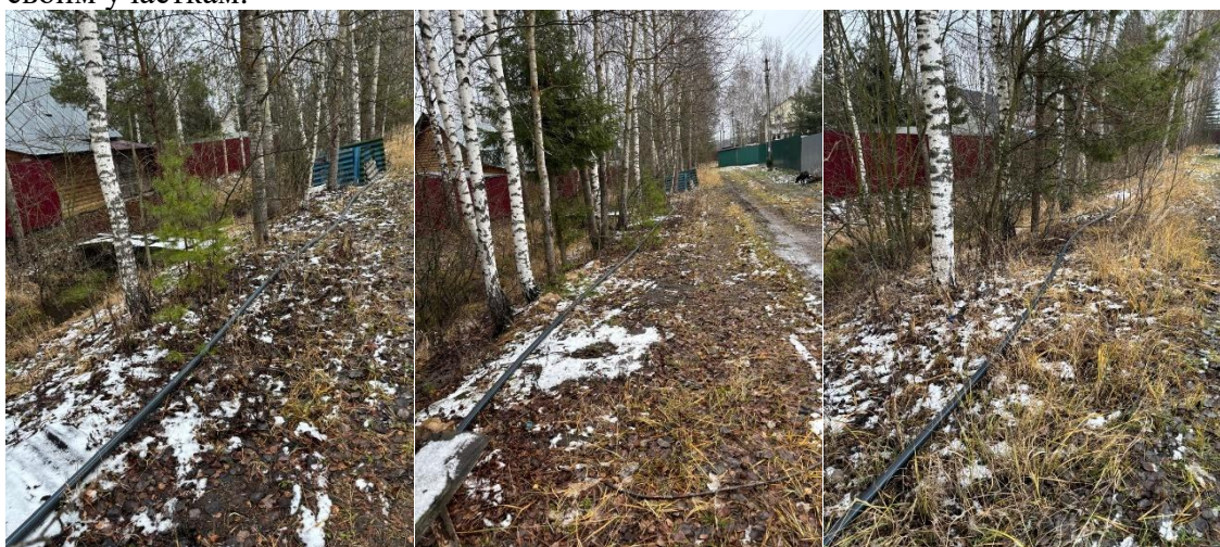
на фото распределительная магистраль, проложенная по канаве