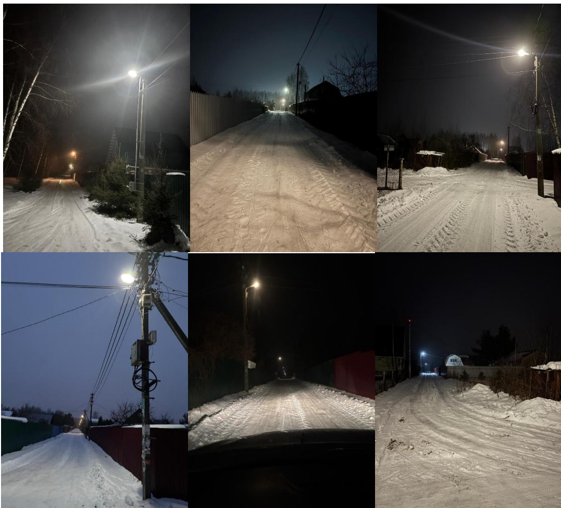
на фото уличное освещение СНТСН «Луговина» в темное время суток

!!! Примечание: пока не все должники оплатили взнос на монтаж уличного освещения по целевому взносу 07.08.2021 года, в связи с чем по мере поступления от них оплаты, заявки на установку дополнительных фонарей принимаются.