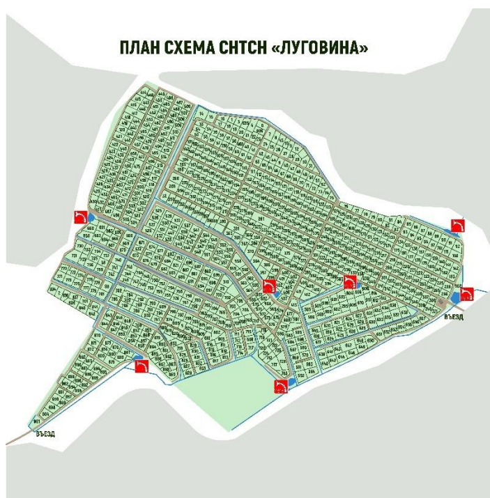
макет плана схемы