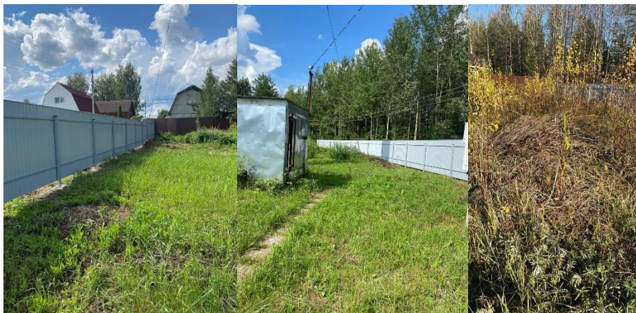
на фото (справа) покосенная трава, (слева) одна из многочисленных куч сухого хвороста