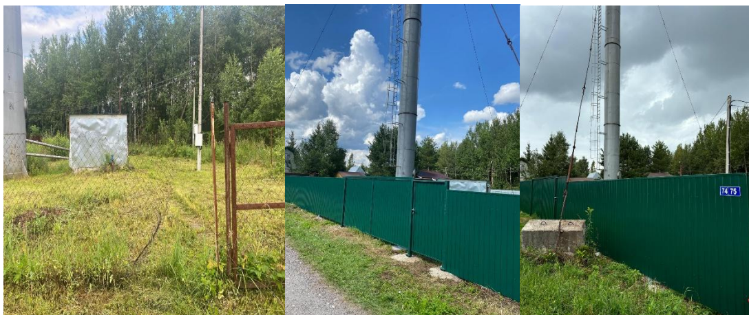
на фото (слева) старый забор, (справа) новый забор